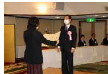
厚生労働大臣表彰

年金委員功労者表彰 厚生労働大臣表彰をはじめ県内8名の年金委員が 受賞されました。