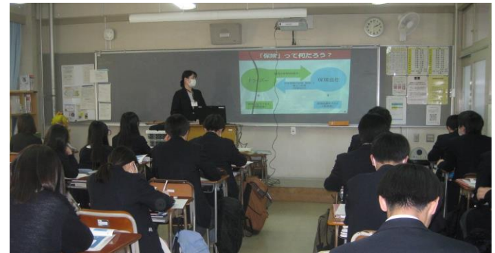
年金セミナーの様子