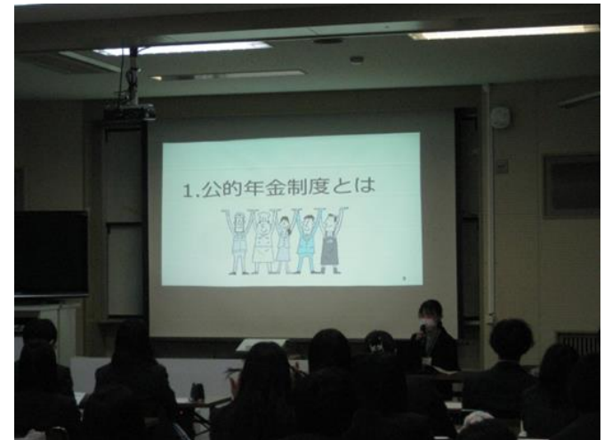
年金セミナーの様子

今後も、講師のスキルの向上を図り、引き続き分かりやすい年金制度の周知に努めてまいります。