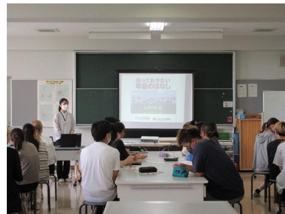
年金セミナーの様子