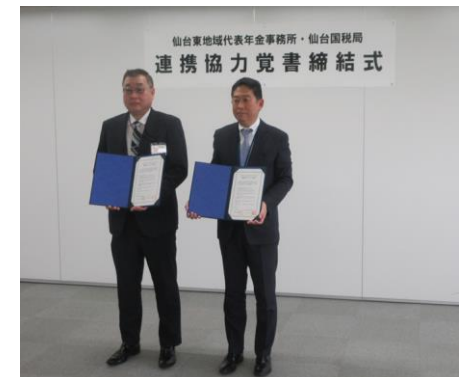
連携協力覚書締結式の様子

東北管内の税務署および年金事務所間において、双方における制度周知にかかる広報、および教育機関での租税教室と年金セミナーの共同開催の拡充等、税や社会保険制度等、社会との接点に関わる教育の充実やお客様の利便性向上、並びに双方の制度普及と基幹事業の円滑な運営のため連携・協力していきます。