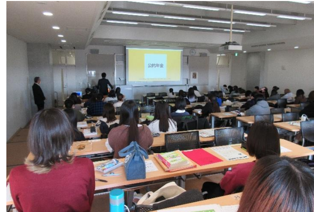
年金セミナーの様子

令和6年度は、オンラインでの動画提供を含め、積極的に年金セミナー開催を目指したいと思います。