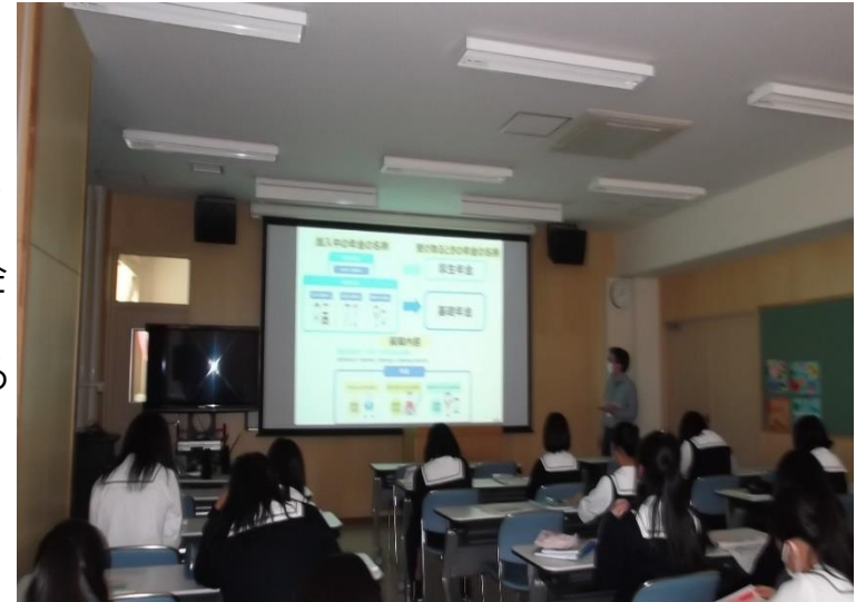
年金セミナーの様子