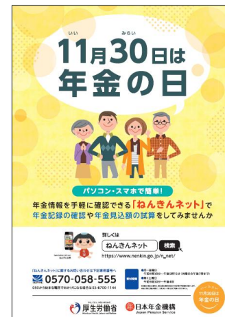
「年金の日」のポスター

100名以上の来訪者に作品をご覧いただいたほか、最終日の11月11日(土)は、年金相談会も開催し、ご相談いただいたお客様に年金受給等にかかる情報提供を行いました。