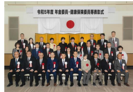
表彰伝達式の様子