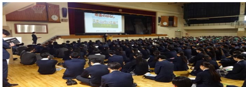
年金セミナー（山村学園高等学校）