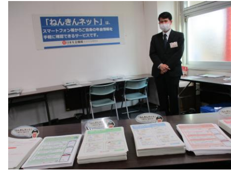
制度説明会（確定申告会場）