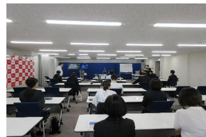
窓口対応コンテスト会場の様子