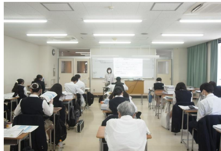
年金セミナー（埼玉県栄養専門学校）