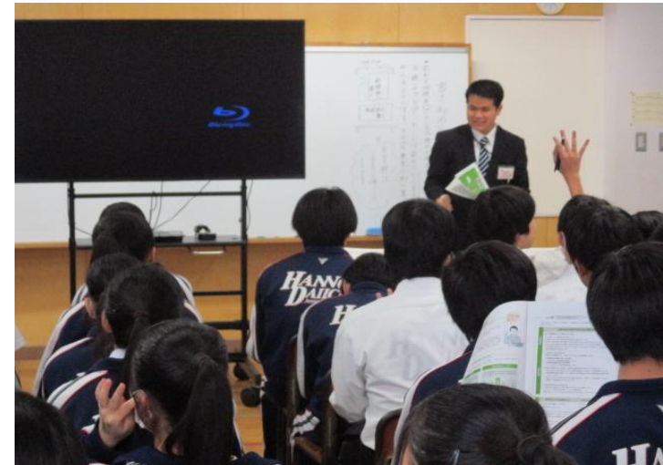
年金セミナー（飯能第一中学校）