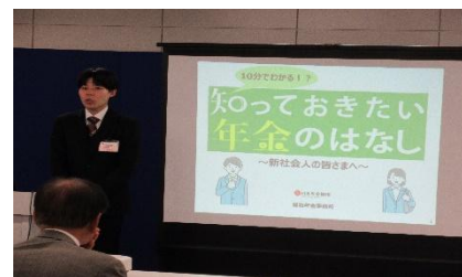
年金セミナー・制度説明会王決定戦の様子