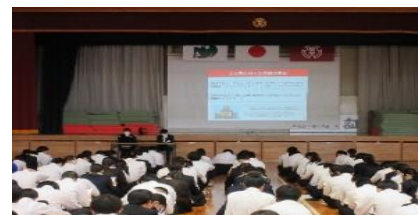
年金セミナー（広島中学校）