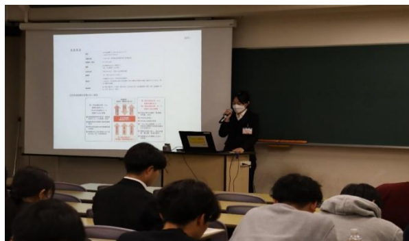
年金セミナー（埼玉大学）