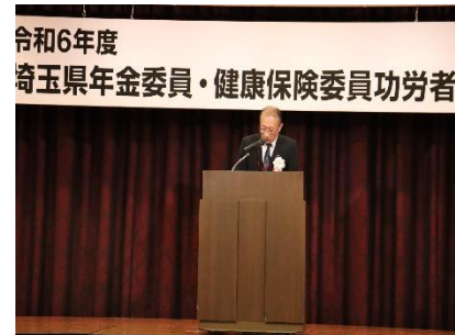
表彰式会場の様子